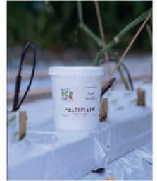
Feltiella en place dans une culture de roses