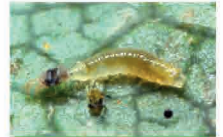
Larve de Feltiella acarisuga consommant des acariens