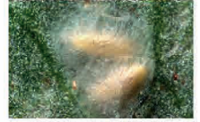
Cocon de Feltiella acarisuga

Feltiella acarisuga (anciennement Therodiplosis ) est une cécidomyie présente naturellement. Les stades larvaires prédatent tous les stades d'acariens. L'adulte a la capacité de localiser les foyers d'acariens au sein de la culture, même si les auxiliaires sont lâchés en un point unique. Les larves sont de couleur jaune à marron clair et atteignent 1.9 mm de long à l'issue de leur développement. La pupaison a lieu à l'intérieur d'un cocon soyeux blanc tissé sur la feuille, en général à la face inférieure, à proximité d'une nervure.